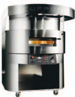
Tutto per la pizzeria

VENDITA ≈ ESPOSIZIONE ≈ ASSISTENZA TECNICA ATTREZZATURE PER BAR GELATERIE E PASTICCERIE