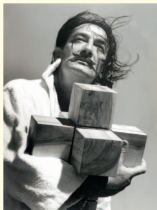
► Salvador Dalí.