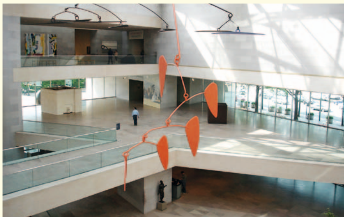
► National Gallery of Art di Washington.

«Inizia a disegnare e a dipingere come gli antichi maestri. Dopo potrai fare quello che vorrai: tutti ti rispetteranno». Così scrisse Salvador Dalí . Così Palazzo Blu di Pisa, iniziando da questa citazione, racconta “Il sogno del classico” del maestro catalano attraverso una selezione di opere che illustrano la riflessione seria e profonda sull'arte affrontata dallo spagnolo, un artista e un intellettuale molto complesso. A fianco dei dipinti troviamo in mostra l'intera serie di xilografie che illustra la Divina Commedia. E poi un Dalí disegnatore, illustratore e intellettuale appassionato di letteratura, attraverso ventisette disegni e acquarelli che raccontano la leggendaria vita di Benvenuto Cellini. La mostra dunque mette a confronto Dalí con la tradizione antica e con i grandi Maestri italiani e presenta un aspetto particolare del surrealismo daliniano.