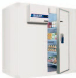
Impianti e celle frigorifere

TRENTO – Via Stoppani, 8 Tel. 0461 823747 r.a. Fax 0461 427469 frigoexpress@frigoexpress.it