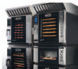
Forno a convenzione per la ristorazione professionale