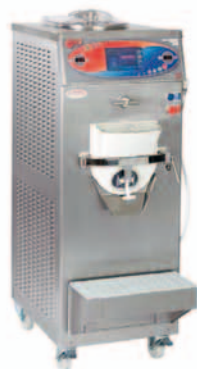
Trittico® Bravo per la gelateria e la pasticceria artigianale