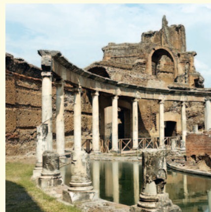
► Villa Adriana.