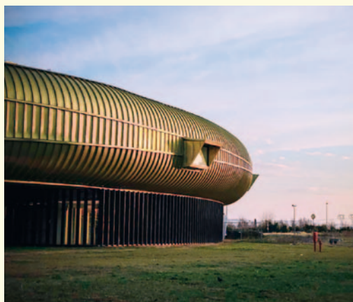
► Centro per l'Arte Contemporanea Luigi Pecci.