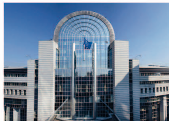
© Association des architectes du CIC Vanden Bossche sprl, C.R.Vsa., CDGsprl, Studiegroep D.