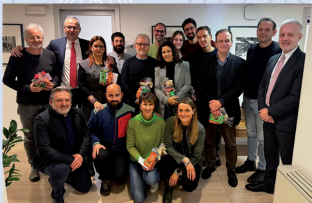
CATEGORIE E AREA INFORMATICA TRENTO