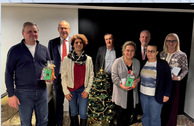
CAAF E IV PIANO OVEST TRENTO