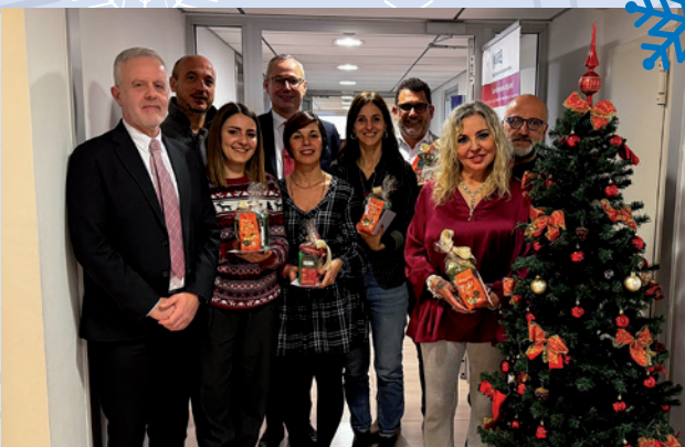
MARKETING, COMUNICAZIONE, FORMAZIONE, SCUOLA TRENTO