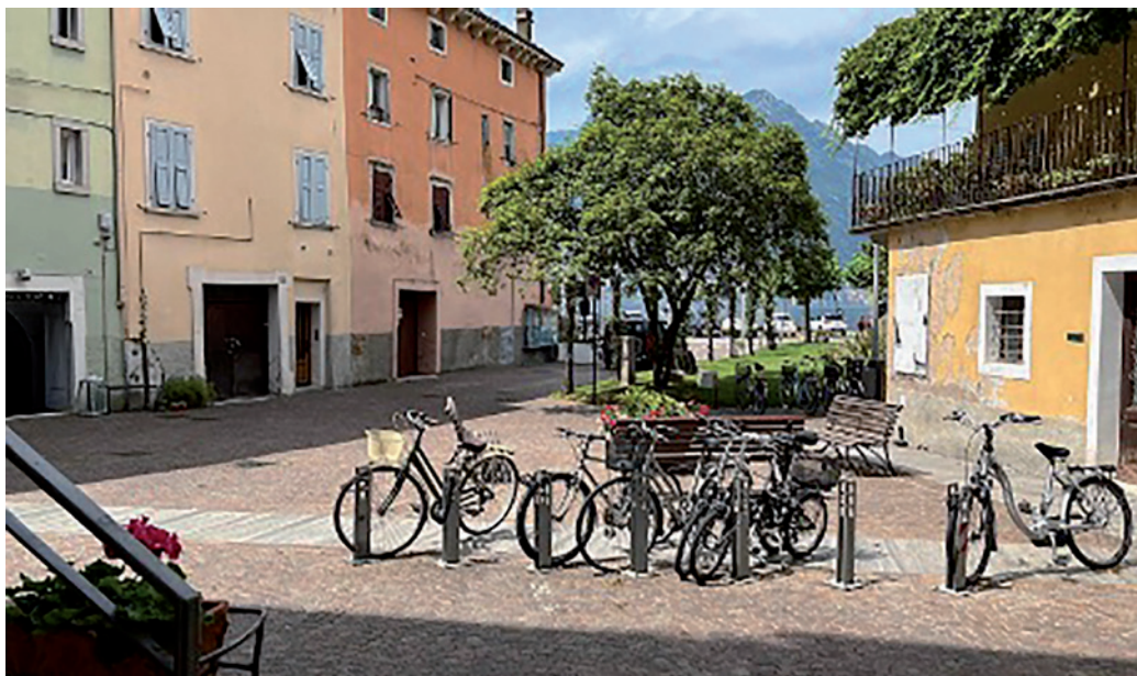
Uno scorcio di Piazza Alpini a Torbole

con un trancio di pizza in mano e una bibita nell'altra. Come ho fatto tante volte lungo il Tevere. Semplice, spontaneo, vero. In quel momento ho capito che era il posto giusto per partire. E in questo l'Associazione Artigiani Confartigianato Trentino mi è stata vicina, aiutandomi ad orientarmi e supportandomi nei vari step burocratici. Questo sostegno è stato prezioso.