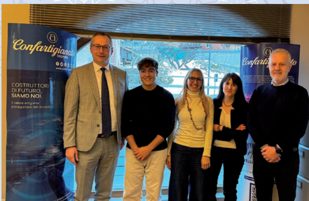
POZZA DI FASSA