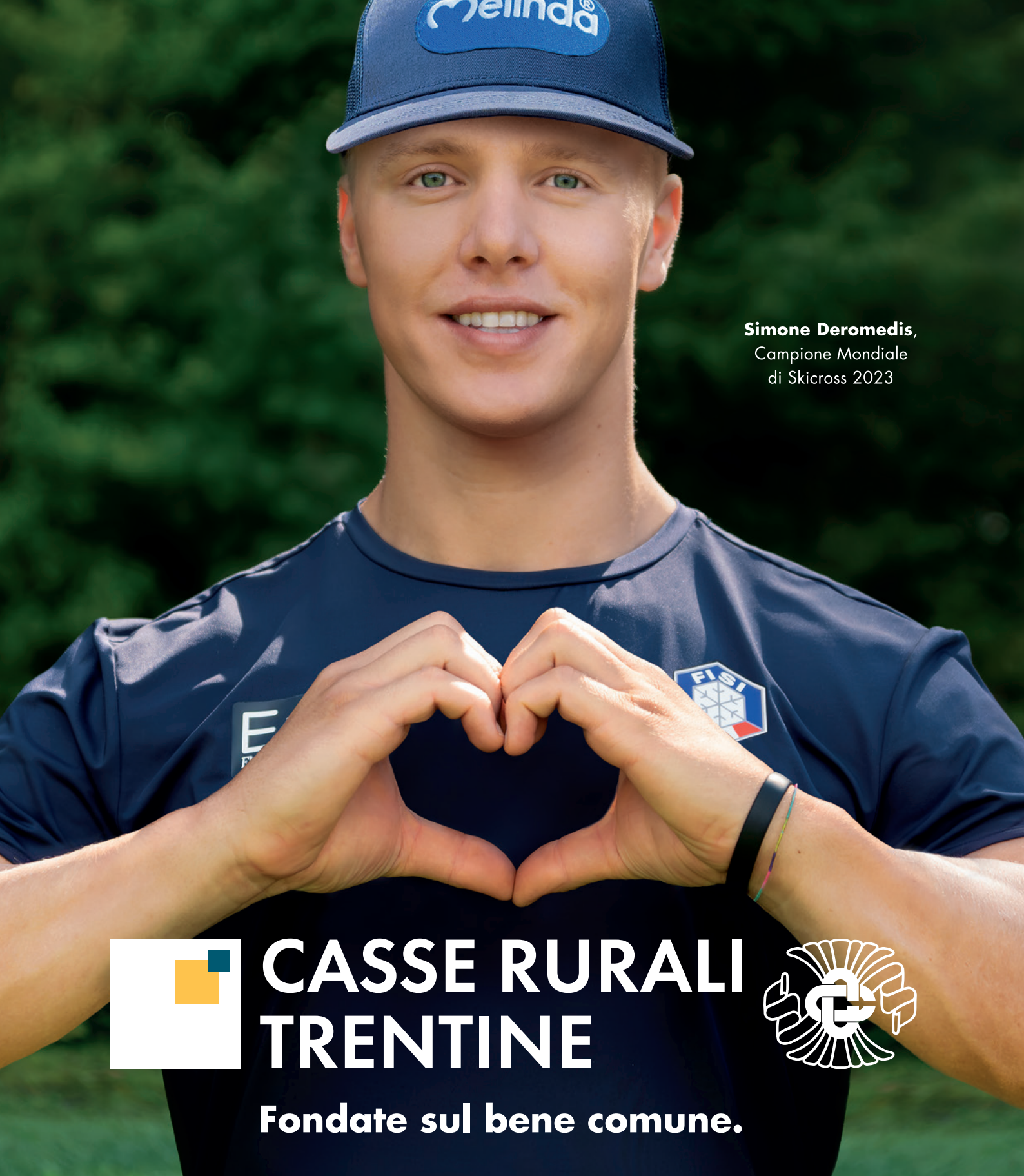
Simone Deromedis, Campione Mondiale di Skicross 2023