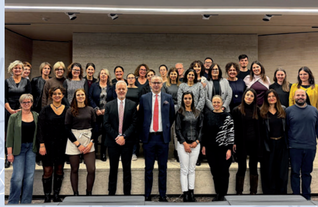
AREA PAGHE E CONSULENZA DEL LAVORO