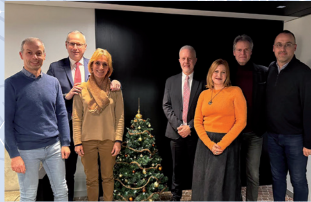
TRENTO IV PIANO