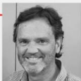
Eduardo Setien Laboa